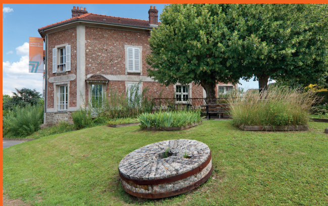
Vue extérieure du musée

01 60 23 80 24. Si le temps le permet, vous pouvez pique-niquer derrière la mairie au bord du Petit Morin.